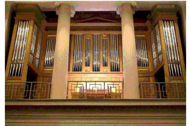
Die große Wagner-Organ

1965-68 wurde das Kircheninnere vollständig umgestaltet (Anstrich, Fensterverglasung, Steinfußboden mit Heizung, Beleuchtung, Bestuhlung, Altar, Kanzel und Taufbecken). 1973 wurde die Schieferabdeckung des Turms durch Kupferverkleidung ersetzt.