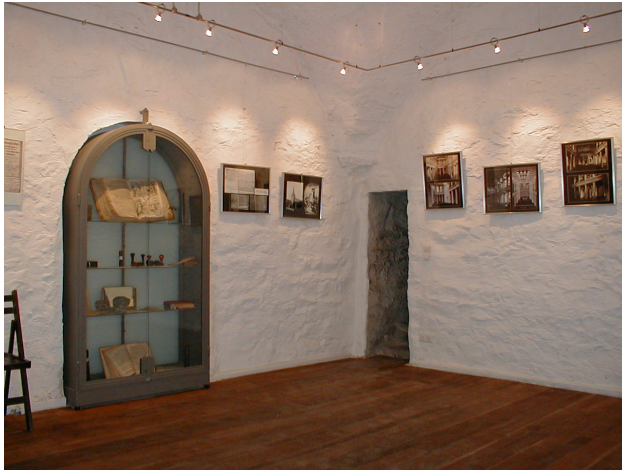
Das Turmzimmer der Walder Kirche, der älteste Raum Solingens, wird u.a. genutzt als Ausstellungsraum

Bereits um das Jahr 900 wird eine einfache Saalkirche aus Holz an der Stelle der heutigen Walder Kirche vermutet. Am 3. Mai 1019 schenkte Heribert, Erzbischof von Köln, den Hof und die Kirche in Wald der von ihm gegründeten Abtei Deutz. Der Fronhof, auch Deutzer Hof